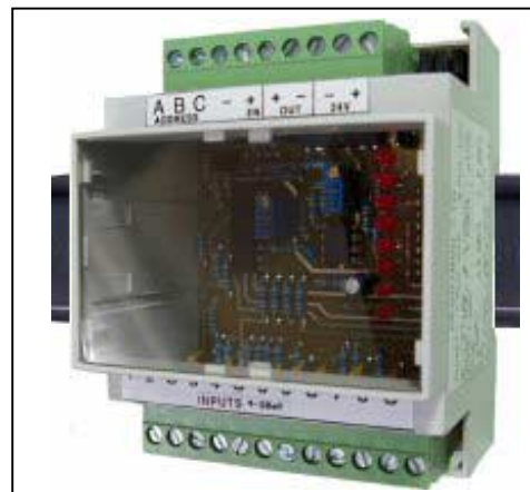
אות בכניסת פיקוד (קוד) ומספר הכניסה: